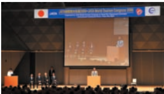
特別(併催)プログラム

日時 9月18日(木) 9:30~20:00 場所 東京ビッグサイト 国際会議場 テーマ 日本海外旅行市場の再活性化に向けて Part2 —アジア大旅行時代、徹底検証— 参加者 1,150人 (97カ国・地域)