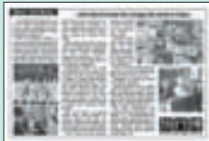
『The Japan Times』9月19日